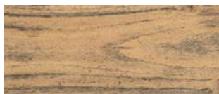
Unbehandeltes oder mit herkömmlichem Öl behandeltes Holz ohne UV-Schutz.