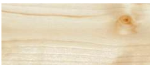
Mit Osmo UV-Schutz-Öl behandeltes Holz.